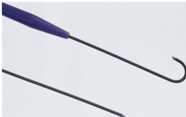
Obrázek 2: Náčrves vodicího drátu rovného, s hrotem ve tvaru písmene J a typu Benton