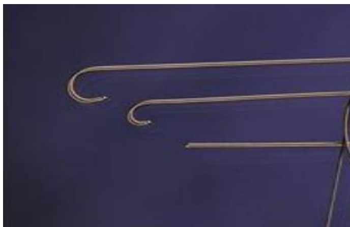
Tabel 3.1.-1: Udgaver af Argon Guidewire