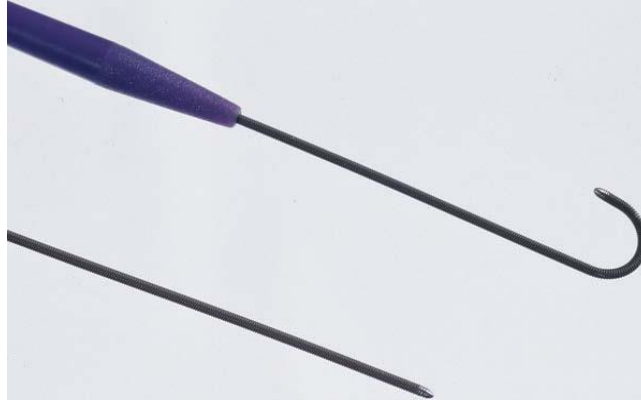
Figure 2 : Illustration des fils-guides standard et Bentson droits et à extrémité en J