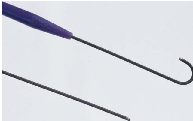
Figuur 2: Tekening van rechte en J-tip Standard- en Bentson-voerdraden